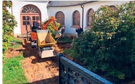
Baufachbetrieb Schuricht aus Remse mit Technik am Werk im April

Zum Arbeitseinsatz im März haben kräftige Männer die Gehwegplatten und Borde entfernt und das Baufeld freigemacht. Die Rhododen-