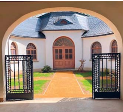
Die Wiese ist angesät, die Rhododendren wachsen noch