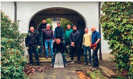
Arbeitseinsatz vom Förderkreis am Innenhof der Friedhofshalle am 16. März

Es ist Anfang Mai, die gestutzten Rhododendren treiben schon wieder