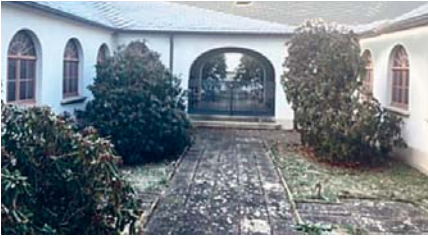
Innenhof vor Beginn der Arbeiten

und Einsatzbereitschaft der Bürgerschaft. Lohn dafür ist ein wunderbarer Ort der Stille und Erinnerung. Vielen Dank!